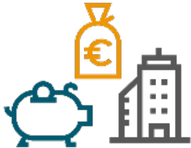
Eigendom van funds/assets